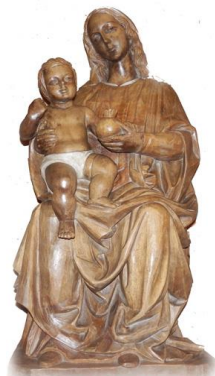
PARROQUIA NUESTRA SEÑORA DE LA GRANADA

¡En marcha! Ponernos en camino es un mensaje continuo en la predicación del papa Francisco. El Santo Padre nos pide reiteradamente que salgamos de nosotros mismos, que vayamos a las periferias... Pero esa salida no es andar alocadamente de un sitio para otro, sino una actitud del corazón. Es una invitación a no mirarnos a nosotros mismos, a no estar dando vueltas a nuestras cosas, a no andar contemplándonos continuamente en el espejo o, ¿cómo no?, haciéndonos selfis que muestran de forma distorsionada lo que pretendemos ser y hacer.