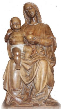
PARROQUIA NUESTRA SEÑORA DE LA GRANADA