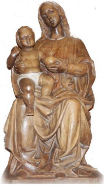
PARROQUIA NUESTRA SEÑORA DE LA GRANADA