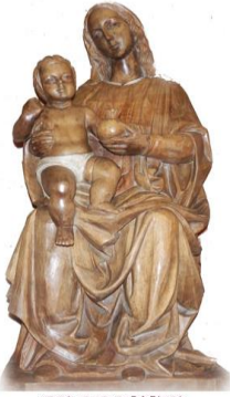
PARROQUIA NUESTRA SEÑORA DE LA GRANADA

El domingo pasado, después de celebrar la Eucaristía, se acercó a mí una pareja. Eran de fuera de España, venían a pasar unos días y habían estado en la Misa de 12:00 horas en la catedral. Querían hablar conmigo en algún momento durante la semana que pasarían en Madrid; les dije que sí, me dejaron su teléfono y los llamé. Eran bautizados, no practicantes desde muy jóvenes. Hacía muchos años que no iban a Misa y, por curiosidad, habían entrado en la Almudena. En la Eucaristía habían sentido la necesidad de hablar con algún sacerdote y, por eso, se acercaron a mí. Después de la conversación con ellos y a las puertas de la fiesta del Corpus Christi, me gustaría hacer una meditación en voz alta sobre la Eucaristía. No es un tratado, sino que, como toda meditación, quiere alcanzar tu corazón y tu vida.