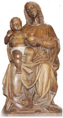
PARROQUIA NUESTRA SEÑORA DE LA GRANADA